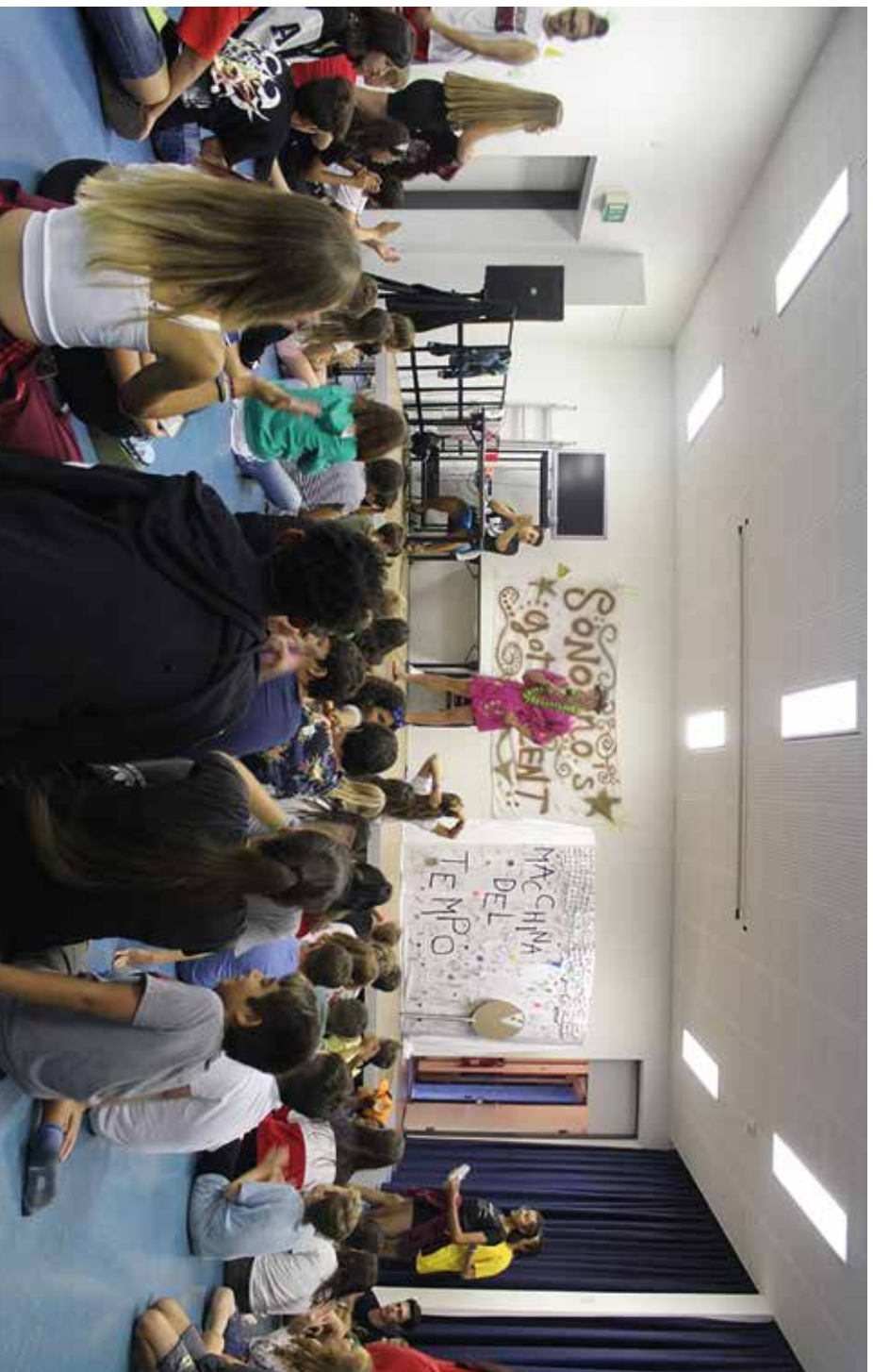
Ci sono solo due lasciti inesauribili che dobbiamo sperare di trasmettere ai nostri figli: delle radici e delle ali.

Dobbiamo imparare dai bambini. Amano senza dubitare. Abbracciano senza avvisare. Ridono senza pensarci. Scrivono cose colorate sulle pareti. Credono ad almeno 10 sogni impossibili.